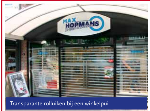
Transparante rolluiken bij een winkelpui