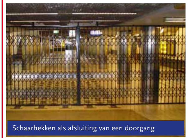
Schaarhekken als afsluiting van een doorgang

Vanzelfsprekend is dit een deel van de vele mogelijkheden. Onze adviseurs komen graag bij u op locatie voor een advies op maat.