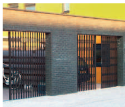
Dubbelvleugelige schaarhekken als afscherming bij carports

Het complete Front Security productassortiment bestaat uit rolluiken, rolhekken en schaarhekken in diverse toepassingen en diverse varianten. Op onze website kunt u alle mogelijkheden en toepassingen vinden.