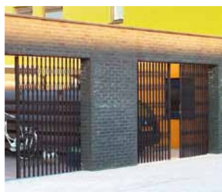
Dubbelvleugelige schaarhekken als afscherming bij carports

Het complete Front Security productassortiment bestaat uit rolluiken, rolhekken en schaarhekken in diverse toepassingen en diverse varianten. Op onze website kunt u alle mogelijkheden en toepassingen vinden.