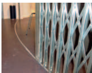
Verzonken onderrail met een gebogen schaarhek