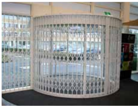
Een gebogen schaarhek als fraaie beveiliging bij een entree.

Schaarhekken kunnen ook gebogen worden geleverd voor bijvoorbeeld tourniquettes of ronde balies. Tevens is een elektrische uitvoering leverbaar.