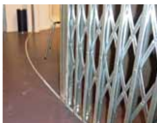
Verzonken onderrail met een gebogen schaarhek