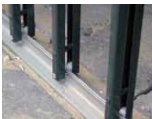
Versterkt, overrijdbare onderrail, geschikt voor carports