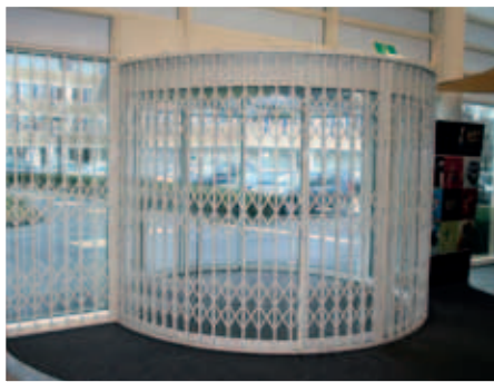
Een gebogen schaarhek als fraaie beveiliging bij een entree.

Schaarhekken kunnen ook gebogen worden geleverd voor bijvoorbeeld tourniquettes of ronde balies. Tevens is een elektrische uitvoering leverbaar.