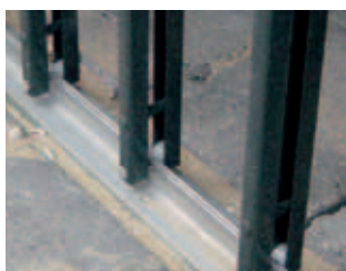
Versterkt, overrijdbare onderrail, geschikt voor carports